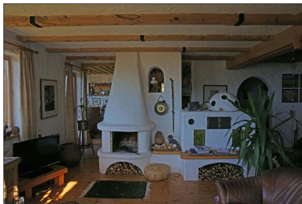
Kachelofen und offener Kamin - Wohnraum