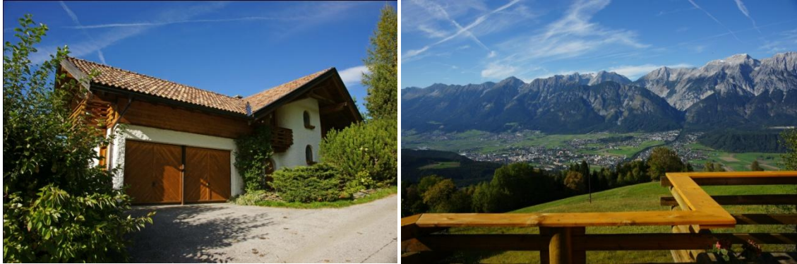
Außenansichten – Ausblick von Terrasse