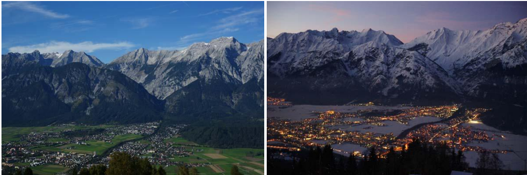
Hall in Tirol – Ausblick vom Haus