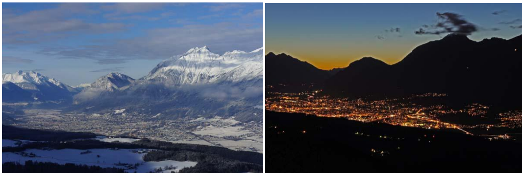
Innsbruck – Landeshauptstadt von Tirol – Ausblick vom Haus

Tulfs: 922 m Seehöhe, ca. 1.422 Einwohner